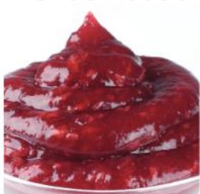
CREDIFRUIT FRUTOS ROJOS

Fruta 60%: Frambuesa, fresa, grosella y guindas